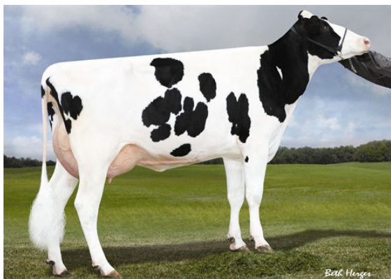
MISS OCD ROBST DELICIOUS GRANDDAM